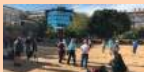
Tai Chi a la platja