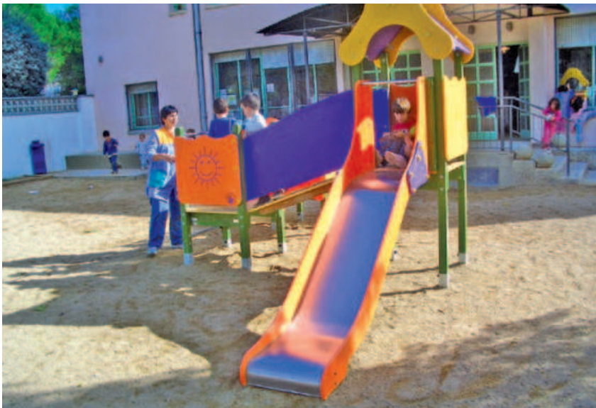
El tobogan instal·lat en el pati de l'escola infantil, un complement d'esbarjo i formació pels més petits.