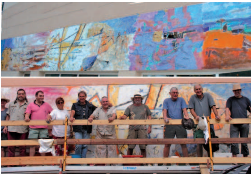
A dalt, una imatge del mural d'homenatge als 50 anys de concurs, pintat a la façana de l'edifici La Nau. Sota, els autors d'esmentat mural, anteriors guanyadors del Premi Internacional de Pintura Ràpida.

que restà a l'edifici de La Nau fins l'11 de setembre. Les obres premiables passaren a formar part de la col·lecció de pintura del patrimoni municipal i les que no van ser escollides, a voluntat de l'artista, es podien vendre un cop inaugurada l'exposició.