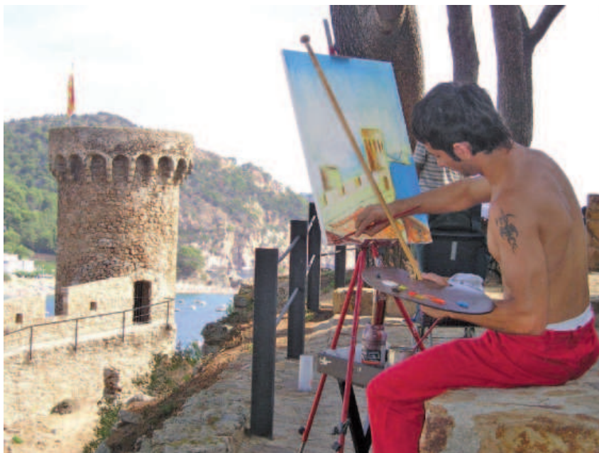
Un dels participants de la cinquantesima edició del Premi Internacional Tossa de Mar de Pintura Ràpida s'inspira amb el torreó de la muralla.

Tossa de Mar va celebrar el passat 27 d'agost el cinquantè aniversari del Premi Internacional Tossa de Mar de Pintura Ràpida i els guanyadors de les darreres edicions obsequiaren a la vila amb un mural commemoratiu.