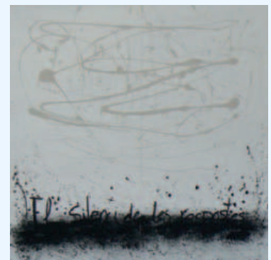
El quadre "El silenci de les respostes" que dona nom a l'exposició, respira la transcendència de les filosofies orientals.