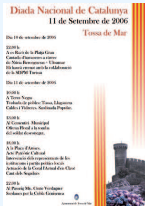
Cartell d'invitació a tossencs i visitants als actes de la Diada de Catalunya.

Els ajuntaments de Tossa de Mar, Vidreres, Llagostera i Caldes es van reunir a Terra Negra per celebrar la Diada Nacional de Catalunya. Una jornada de germanor intermunicipal que va començar a les deu del matí i va congregat centenars de persones al monòlit. L'Ajuntament de Tossa va organitzar una sardina popular. A la una del migdia es va fer al cementiri municipal l'ofrena floral a la tomba del soldat desconegut. A les sis de la tarda la Plaça d'Armes va acollir l'acte Patriòtic Cultural que va comptar amb la intervenció dels representants de les institucions i partits polítics locals i que va acabar amb el Cant dels Segadors. Finalment, a les deu de la nit també es va celebrar una audició de sardanes al passeig Mossèn Cinto Verdguer amb la cobla Genisenca.