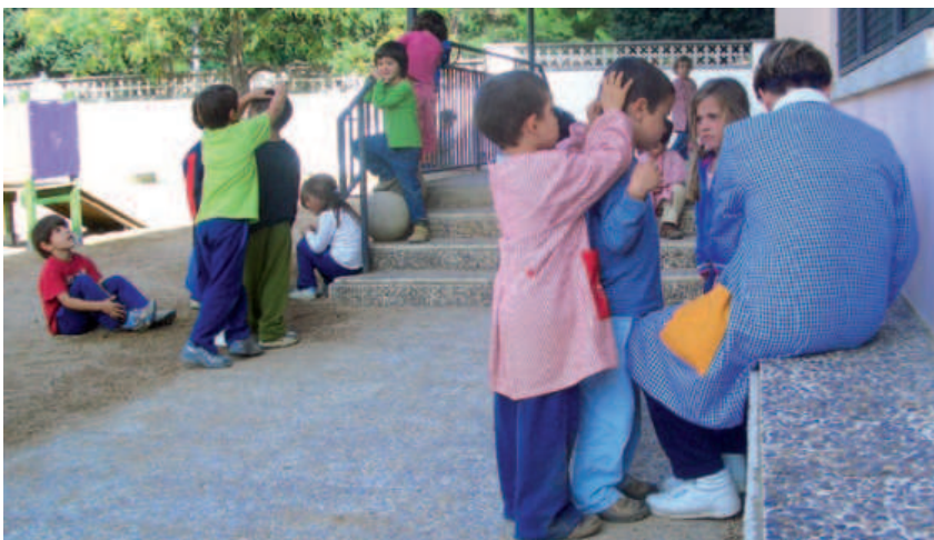
L'inici de curs 2006/07 ha arribat a Tossa sense incidències a les escoles de primària.

Les escoles de Tossa de Mar van obrir les portes al curs 2006/07 el passat mes de setembre sense incidències. D'aquesta manera els nens i nenes en edat escolar van començar les classes d'un nou curs. Cal destacar que aquest serà el primer que els més petits es podran beneficiar del tobogan que s'ha instal·lat al pati d'infantil. Un complement per a l'esbarjo i la formació dels nens i nenes que ha estat finançat entre l'escola, l'Associació de Mares i Pares d'Alumnes (AMPA) i l'Ajuntament. També cal destacar l'augment de col·laboració entre l'escola, la regidoria de Medi Ambient i l'Escola Taller de Tossa. Aquesta última portarà a terme els projectes de l'hort i el jardí a les escoles, tant de primària com infantil. Per aquest curs és previst que les sortides de natura que s'organitzaven als centres s'avancin fins a P-4. La sisena hora també entre en funcionament a Tossa i es dedicarà a activitats complementàries per millorar el rendiment de l'estudiant.