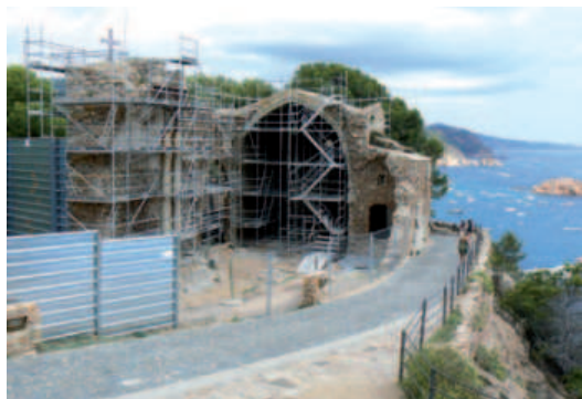
La bastida de l'església vella de Tossa ha permès estudiar l'estat de la pedra tallada i els elements arquitectònics prendre decisions per la seva consolidació.

Des d'aquest estiu s'està treballant en l'església vella de Tossa, de gran permeabilitat amb el paisatge, amb la façana cara al poble i oberta al mar, un patrimoni local que l'ambient marí ha degradat amb els anys. L'actuació prevista es farà amb dues fases. Una primera, que s'està duent a terme en aquests moments, de consolidació, rehabilitació i excavació arqueològica i