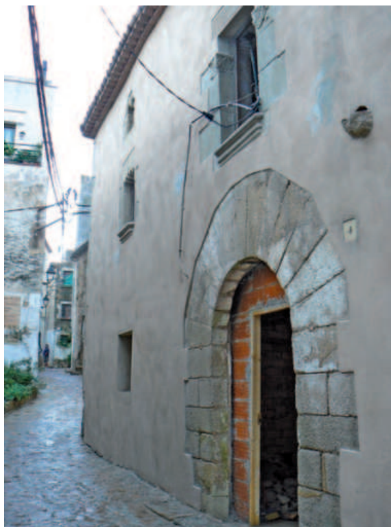
La façana de Can Ganga, situada al carrer Codolar número 4.