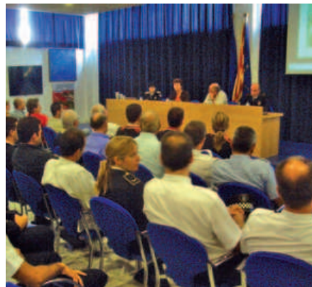
Els agents locals que han participat en situacions destacades van ser felicitats públicament.

Aquest estiu ha estat més segur a Tossa de Mar que el de l'any passat. Així ho confirmen les dades que la Policia Local de Tossa va fer públiques el passat 22 de setembre durant la primera Junta Local de Seguretat. En comparació amb el mateix període de l'any anterior s'ha passat de 279 faltes i delictes a 263. També es va remarcar que hi ha hagut un descens dels robatoris amb força i dels furts. També cal destacar un petit descens dels accidents de trànsit, passant dels 27 sinistres dins el poble a 11. Un descens que també arriba a les carreteres de Sant Feliu de Guíxols i Llagostera, on els accidents s'han reduït de 46 a 20 durant aquest any.