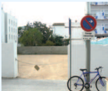
El solar de l'antic hotel Zügel ja està preparat per iniciar la construcció dels habitatges.

Aquesta construcció és una resposta a l'índex que situa Tossa de Mar com una de les poblacions de Catalunya amb més gent gran que viu sola a casa. Un total de quatre empreses opten al concurs d'adjudicació de les obres que pugen uns 900.000€.