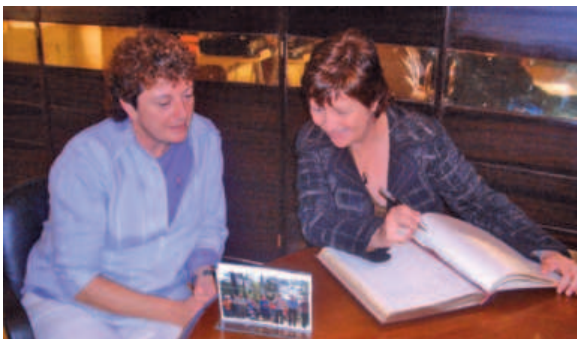
Carme Figueras signa el llibre de l'Ajuntament mentre comenta una foto amb l'Alcalde de Tossa.

La consellera de Benestar i Família de la Generalitat de Catalunya, Carme Figueras, va visitar Tossa de Mar durant la festivitat de Sant Grau. Una visita que va començar a l'Ajuntament local a mig matí. Figueras va signar el llibre d'honor al despatx de l'alcalde de Tossa, Pilar Mundet, seguidament van dirigir-se a la sala de plens on la consellera va observar molt atenta la fotografia de tots els alcaldes que ha tingut Tossa. Durant el parlament la consellera va valorar de forma positiva la construcció de 18 pisos tutelats per a la gent gran a Casa Zügel que prèviament l'alcalde havia explicat. Una construcció que ha de complimentar l'ampliació del geriàtric de Tossa en unes 35 places més.