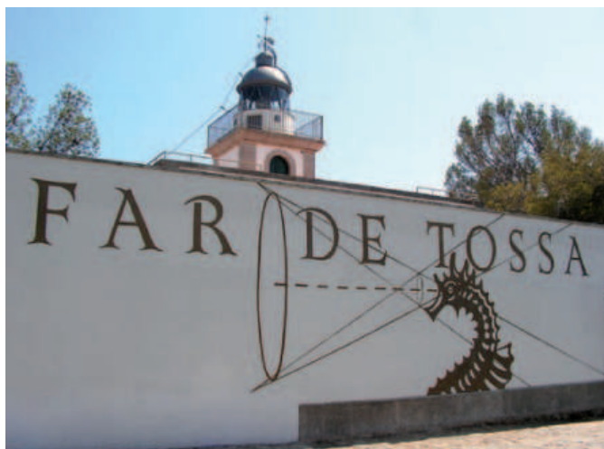
En primer terme, la nova façana del Centre d'Interpretació dels Fars de la Mediterrània, mentre per darrera sobresurt el Far de Tossa.

Les projeccions que s'hi porten a terme són entenedores per a tothom a nivell idiomàtic i serveixen per fer-se una idea de la vida i l'evolució dels fars. En total hi ha quatre projeccions que es reparteixen en tres sales. La primera fa una breu pinzellada de la història dels fars i de la vida dels faroners. En la segona sala la projecció explica l'evolució tecnològica que han partit els fars i finalment es pot observar un vídeo de Tossa de Mar amb el far com a protagonista. La localització del far dins la zona de Vila Vella, li dona un valor afegit i el converteix en un emblema per Tossa. Un altre element important del projecte ha estat la introducció del carrilet. El trenet, que arriba fins a les portes del far en un horari molt ampli –cada mitja hora des de les deu del matí i fins a les vuit del vespre–, ha facilitat l'accés pels visitants que troben en el far un punt de sortida i diversió alternatiu.