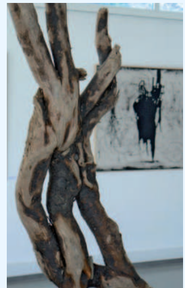
A primer terme l'escultura "Culto a la imperfecció". Al fons, l'obra pictòrica "Percibir la ausència".

La sala Massana de l'edifici la Nau ha acollit durant aquest mes d'octubre l'exposició "El silenci de les respostes", de la jove artista gironina Celia Izquierdo. Les seves obres, exposades per primera vegada, transcendeixen de les filosofies orientals i permeten a l'espectador moure's en terrenys emocionals i desprendre la subjectivitat de cadascú en seva interpretació. L'artista recull un conjunt de pintures i escultures passades pel colador de l'abstracció i les presenta a l'espectador com a finestres ofertes a la relaxació.